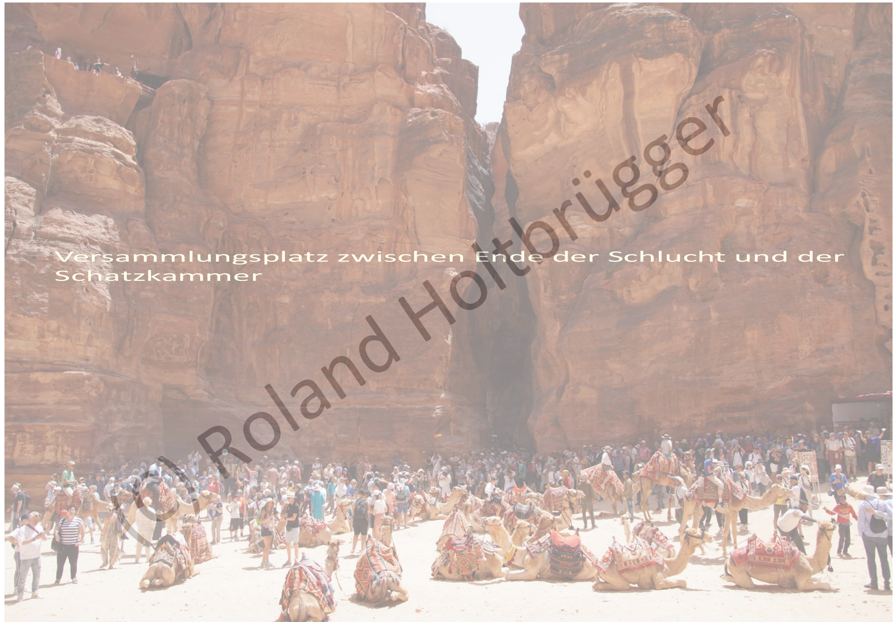
Versammlungsplatz zwischen Ende der Schlucht und der Schatzkammer