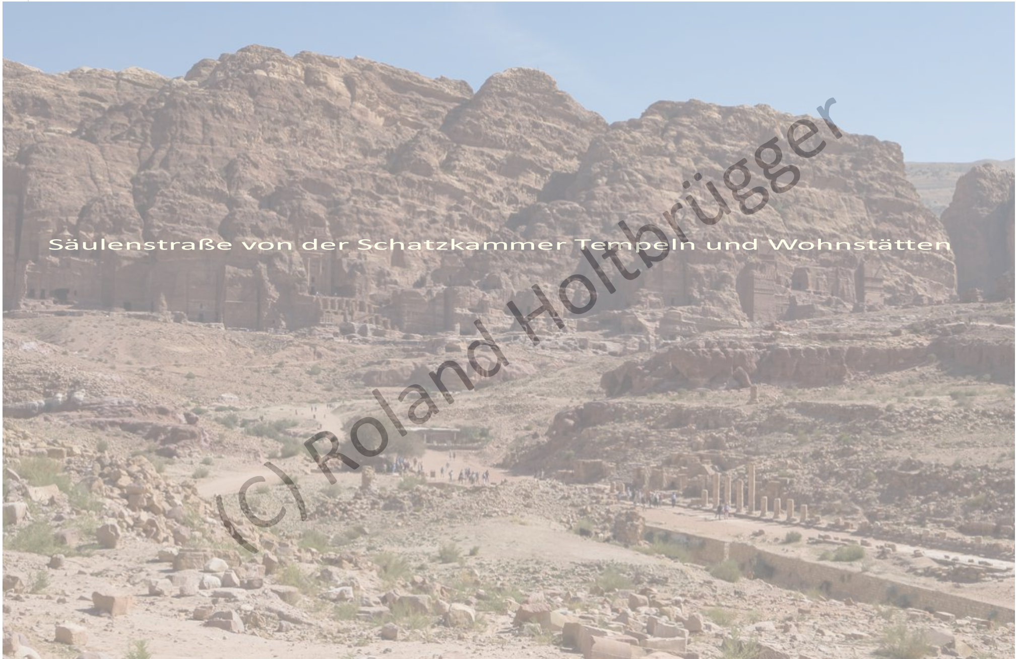
Säulenstraße von der Schatzkammer Tempeln und Wohnstätten