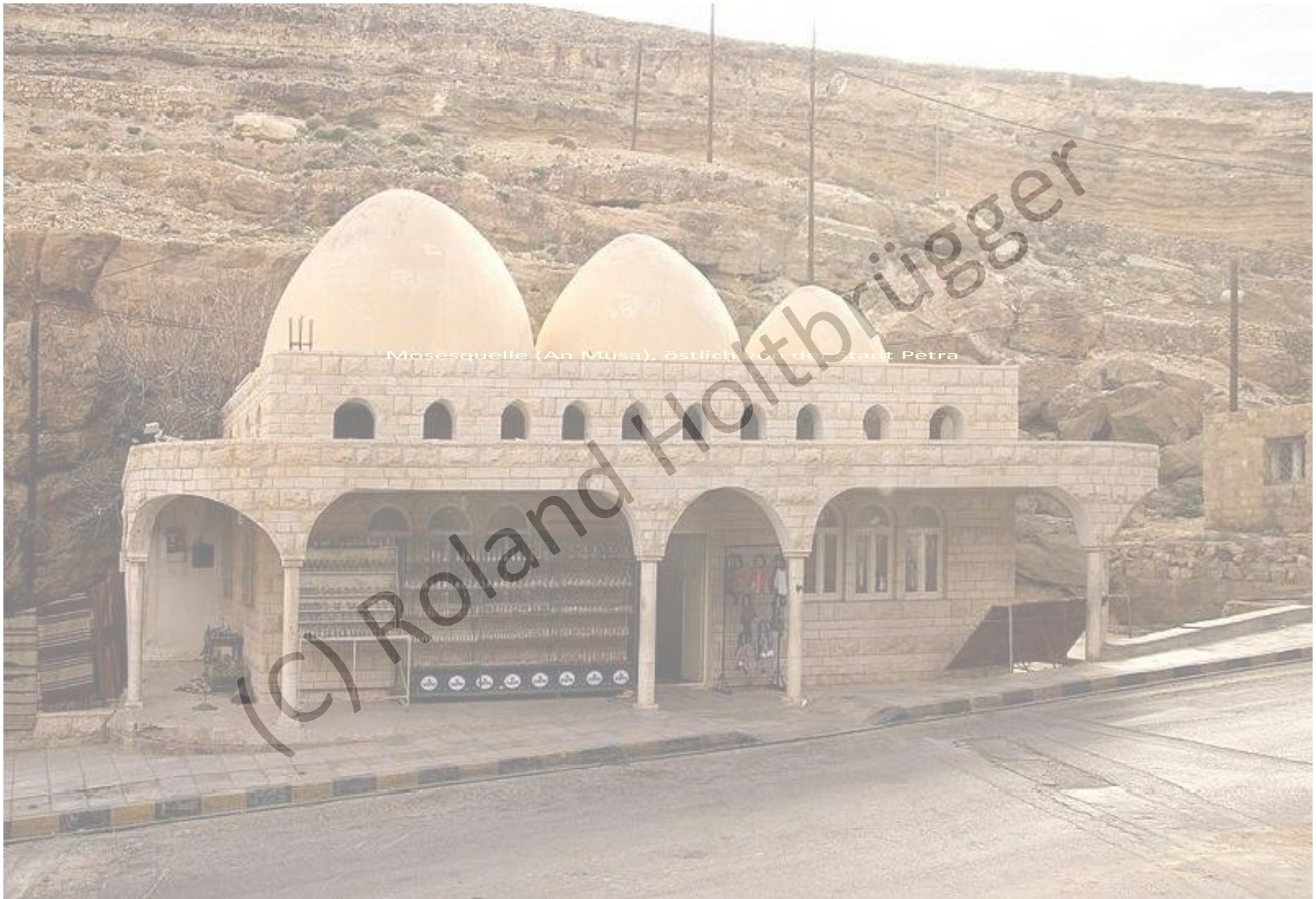
Mosesquelle (An Musa), östlich von der Stadt Petra