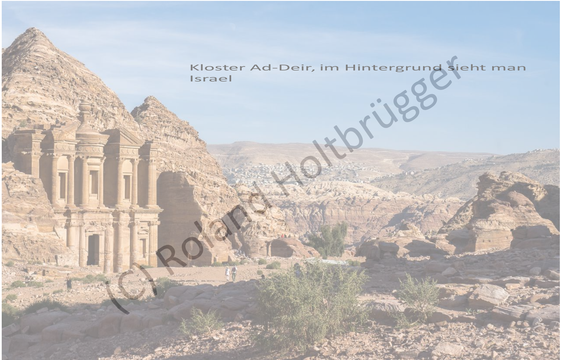
Kloster Ad-Deir, im Hintergrund sieht man Israel