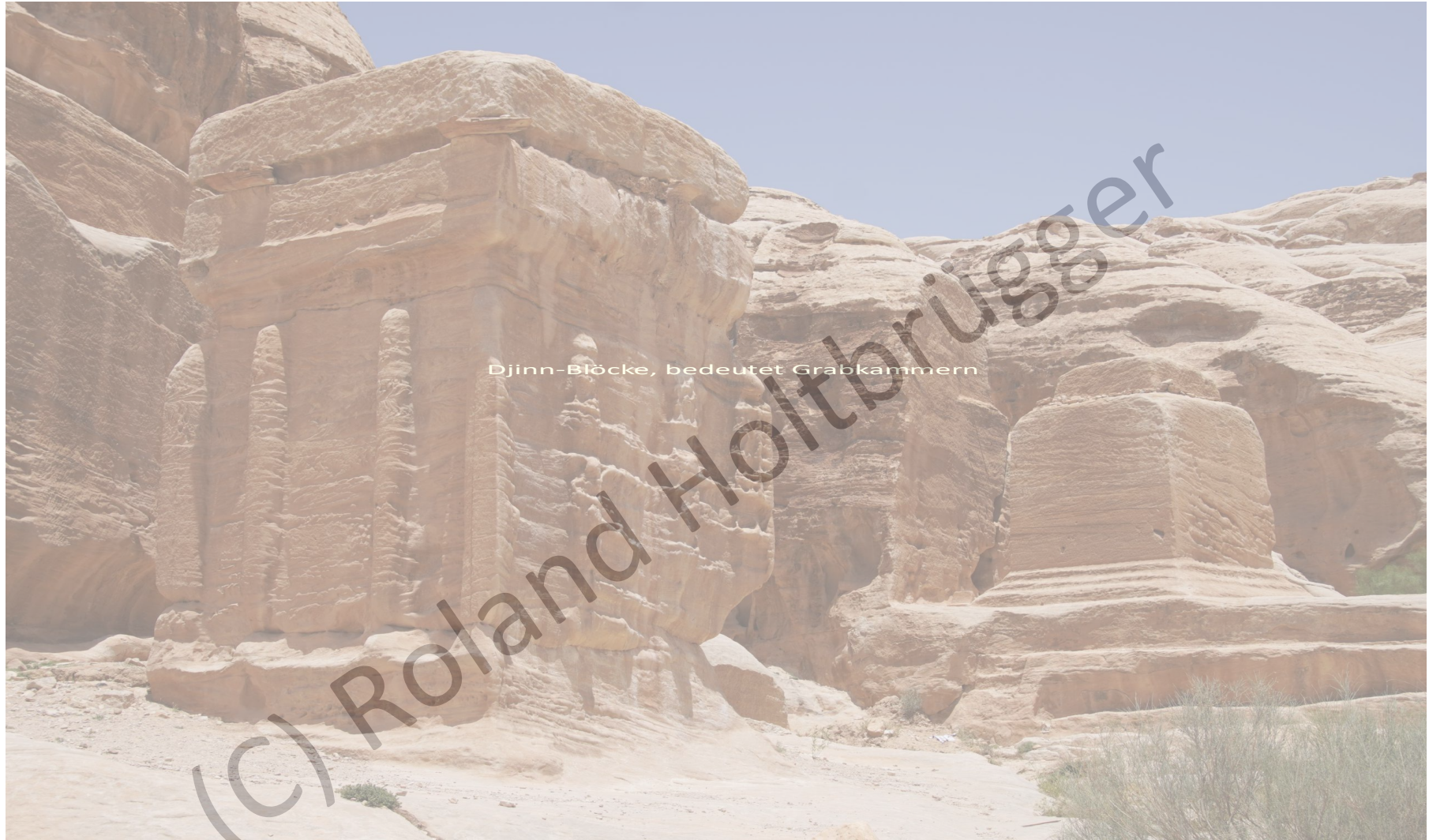
Djinn-Blöcke, bedeutet dämonische Grabkammern