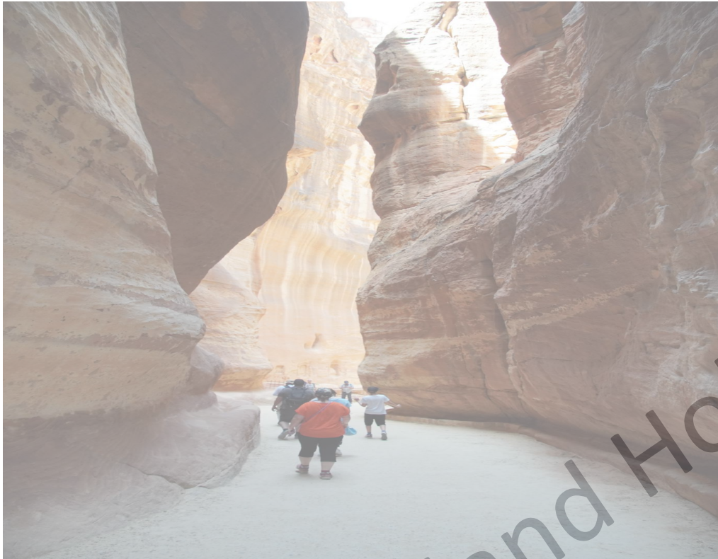
Fossilien in den Wänden Gang durch die Schlucht