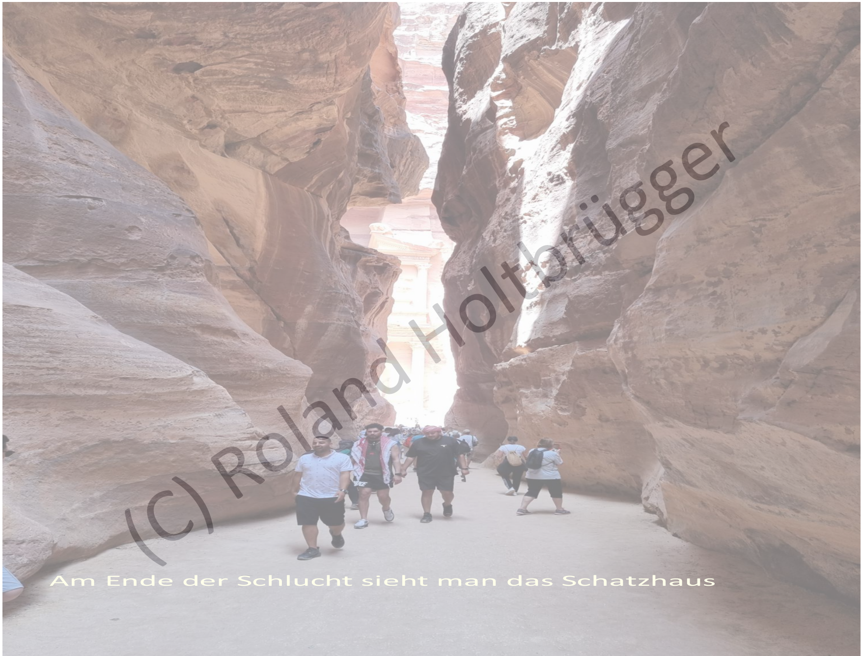
Am Ende der Schlucht sieht man das Schatzhaus