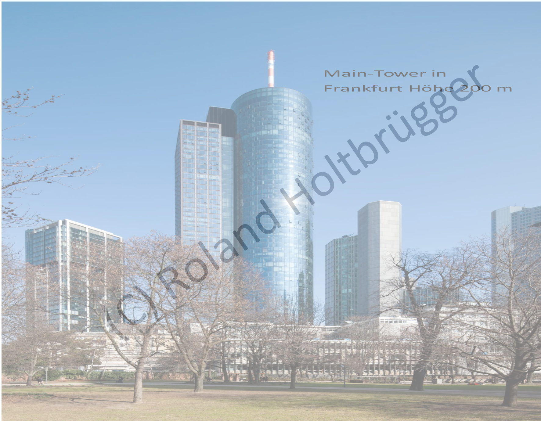
Main-Tower in Frankfurt Höhe 200 m